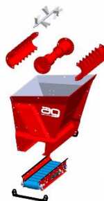
Standaard + Roer-as