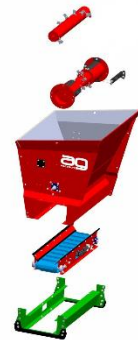
Standaard + HD-Kit